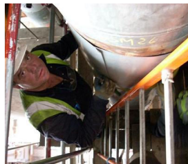
Elektrownia Ironbridge, Anglia 2007

Rekrutacja dla przemysłu stoczniowego: 80 spawaczy MAG(135) + FCAW(136), monterów kadłubów i kowali stoczniowych.