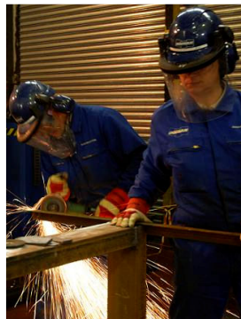
Elektrownia Cockenzie, Szkocja 2008

Dostarczenie i zarządzanie personelem przy remoncie elektrowni. Ponad 170 robotników: spawacze TIG(141) + MMA(111), monterzy rur, ślusarze/spawacze MAG(135) + FCAW(136), szlifierzy, operatorzy dźwignic.