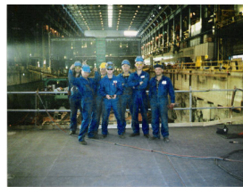
Stocznia w Helsinkach, Finlandia 2006

Projekt rekrutacyjny dla Stoczni Haugesund: 70 monterów kadłubów, monterów rurociągów, spawaczy aluminium i monterów.