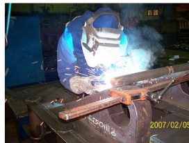
Salmi Steel, Turku, Finlandia 2007

Rekrutacja dla producenta osprzętu platform wiertniczych. Dostarczenie 30 spawaczy MAG(135) + FCAW(136).